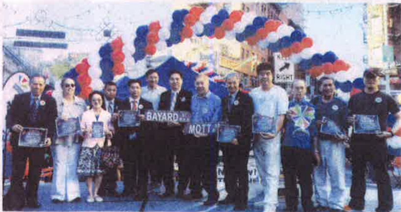
左图:由华埠共同发展机构主办的华埠周末艺游节5日揭幕。