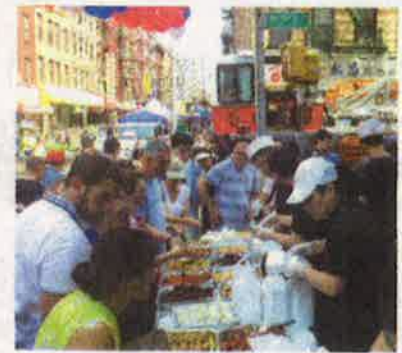
▲ 華埠商家從活動中受益，中午12時左右勿街老正興餐館門口人頭攢動。