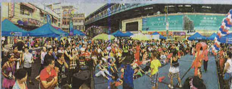
華埠共同發展機構在華埠首次舉辦的夜市精采紛呈。不少華洋遊客紛紛被美食與節目吸引而來。