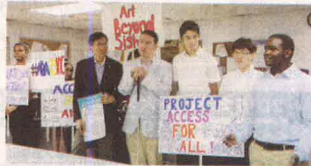
▲慶祝《美國殘疾人法案》25週年,華埠週日辦遊藝節。

據介紹,當天活動及遊藝節由上午11時開始,至下午4時結束。上午有瑜伽演示、中國舞,下午有DJ打碟,及歌劇演唱家Paulette Penzvalto到場演出。活動免費入場,民眾可在不同攤位,瞭解政策及健康資訊。