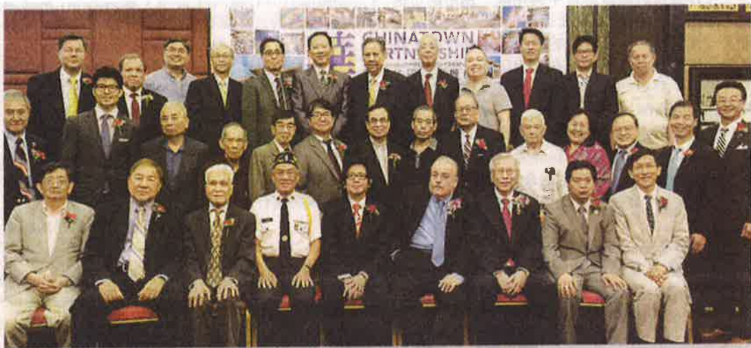
■獲獎者、嘉賓與華埠共同發展機構成員合影。