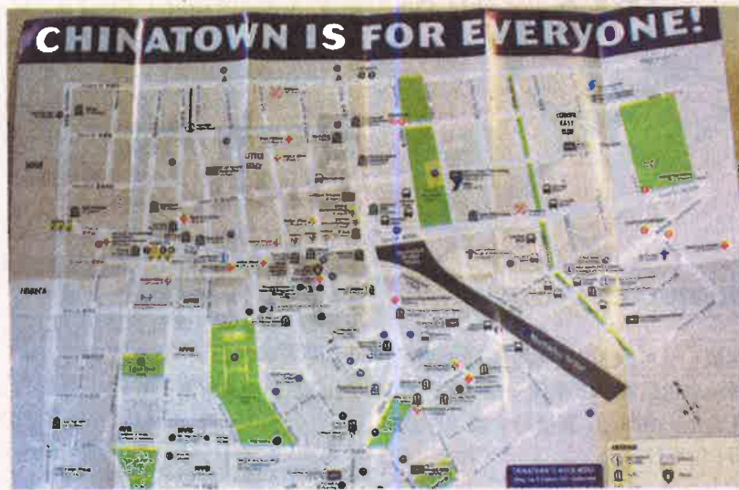
▲《華埠地圖》30日正式面世。

從地圖上看，包厘街以東的下東城及東百老匯等福州新移民社區，密密麻麻的分布了11個長途巴士站和3個小巴士站，主要集中在亞倫街上，而包厘街以西的廣東老僑社區，則入駐了很多社區銀行和華資銀行，數下來有26家之多。門診和藥鋪大約有16家。珠寶行則集中在堅尼路夾包厘街一段。商家分布情況從側面反映了唐人街的經濟特點。