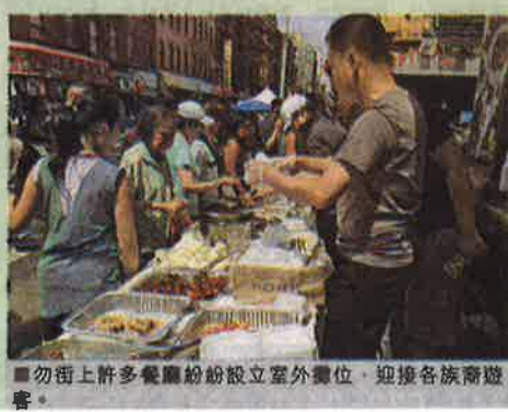
■勿街上許多餐廳紛紛設立室外攤位，迎接各族裔遊客。