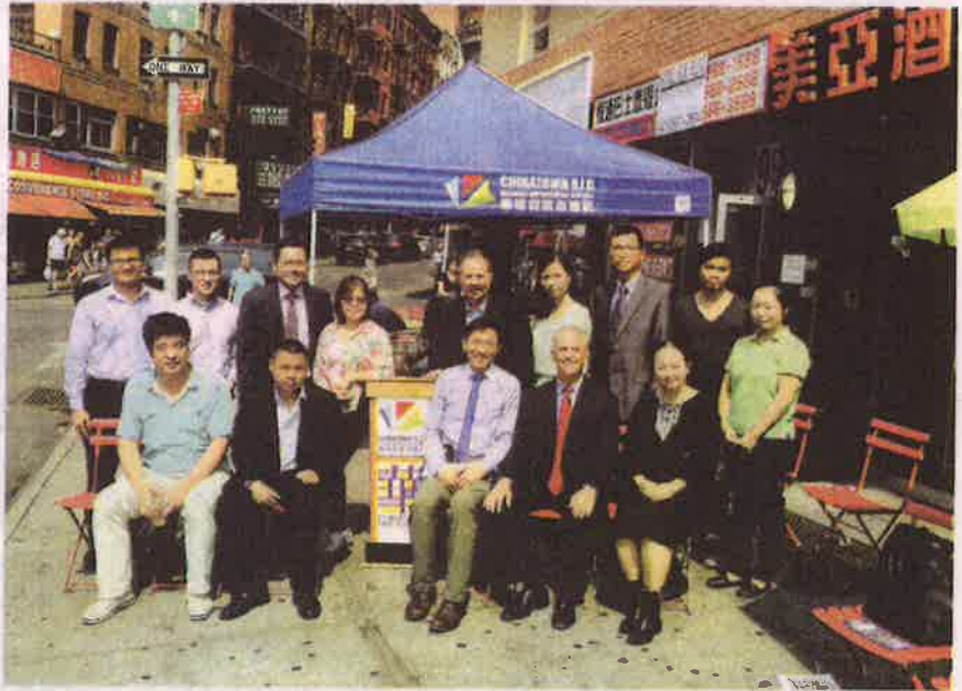
CPLDC及B.I.D3日宣布本周六举办第二届中秋晚会。

陈作舟说,很多纽约客利用劳工节这个长周末外游。不过,亦有民众怕堵交通而留在纽约,更有不少外地人到纽约观光。特别今年的全美华人埠际排球赛在纽约华埠开打,男女队伍合共百支左右,球员、职员和家眷,相信会有超过1000