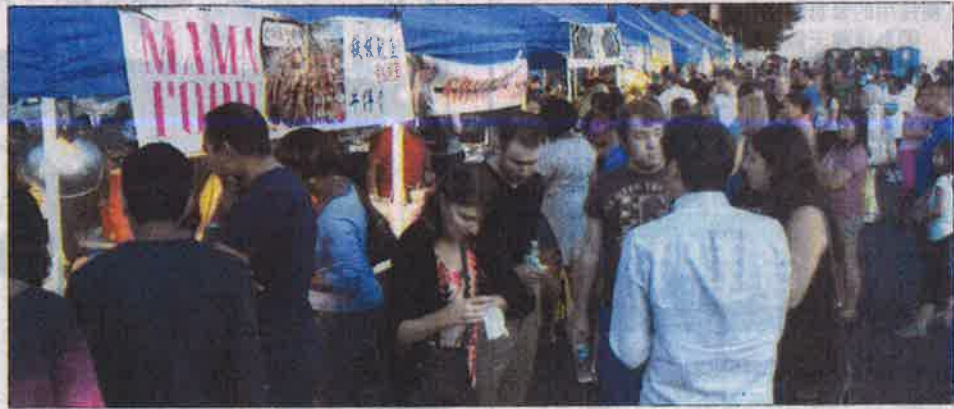
皇后夜市越到傍晚，人就越多，各攤位出現人龍。